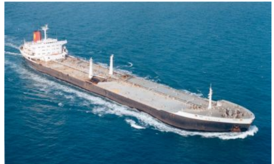
5) Dallia 1967 (roepnaam PJKR) IMO 6621064 Diensttijd van 1967-1985. Bouwer : Rosenberg Mek Verksted Stavanger (bouwnummer 188)